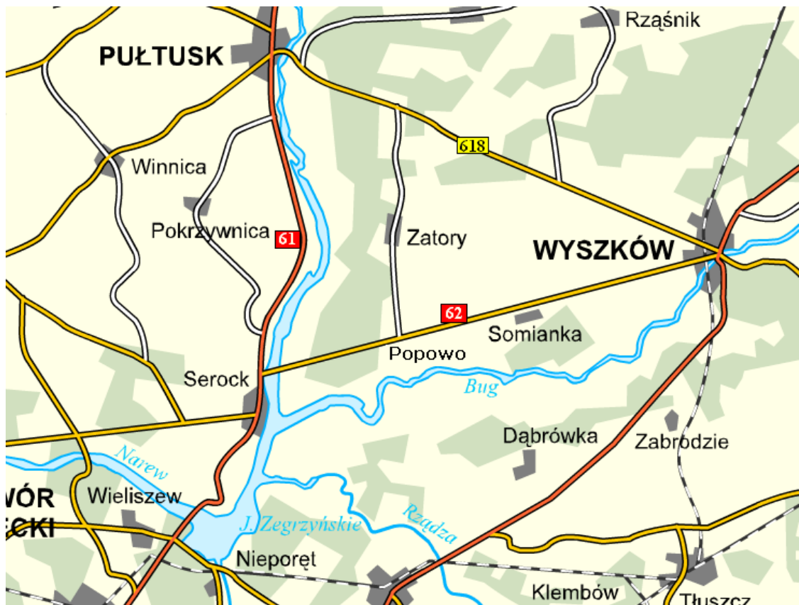
Fot.3 Lokalizacja Zator na mapie drogowej Polski