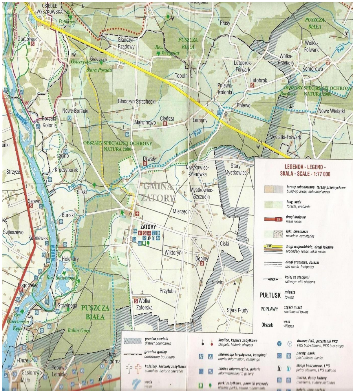
Fot. 2 Mapa Gminy Zatory