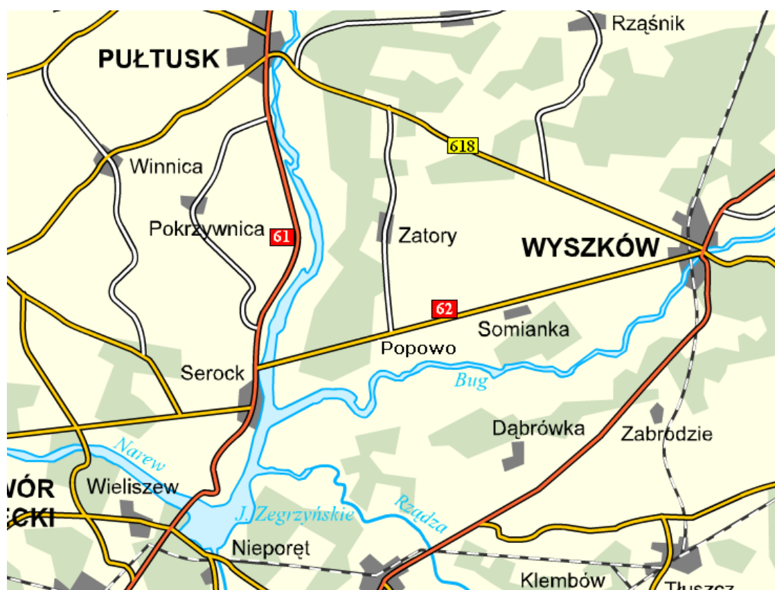
Fot.3 Lokalizacja Zator na mapie drogowej Polski