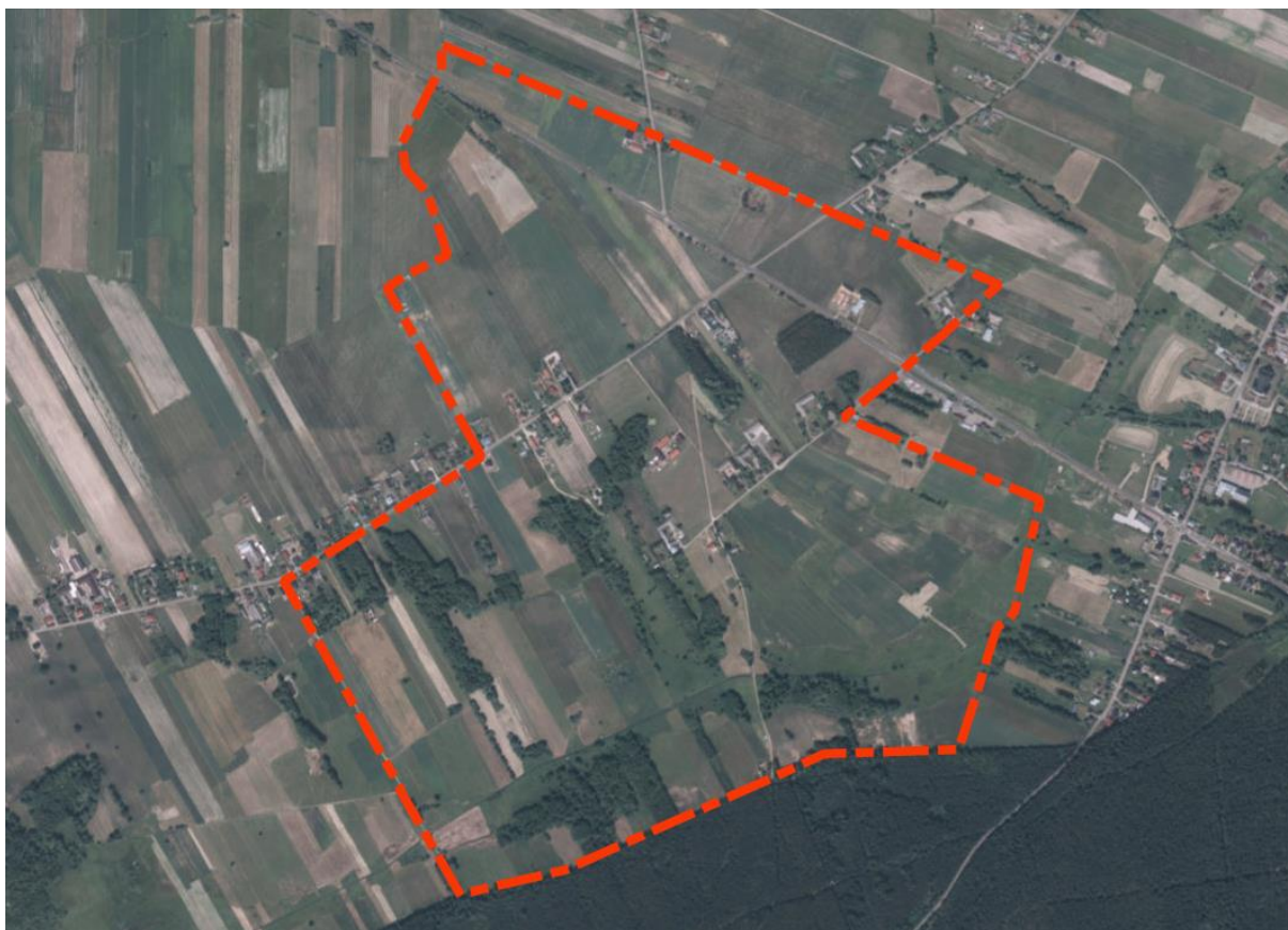
Rysunek 2 Obszar objęty ustaleniami planu miejscowego na tle ortofotomapy.

Krajobraz obszaru opracowania charakteryzuje się dużym udziałem terenów rolnych i leśnych. Występuje tu również zabudowa mieszkaniowa skoncentrowana wzdłuż drogi lokalnej w zachodniej części obszaru oraz obiekty usługowe i produkcyjne występujące głównie w centralnej części. Przez północny fragment obszaru przebiega droga wojewódzka nr 618 klasy głównej.