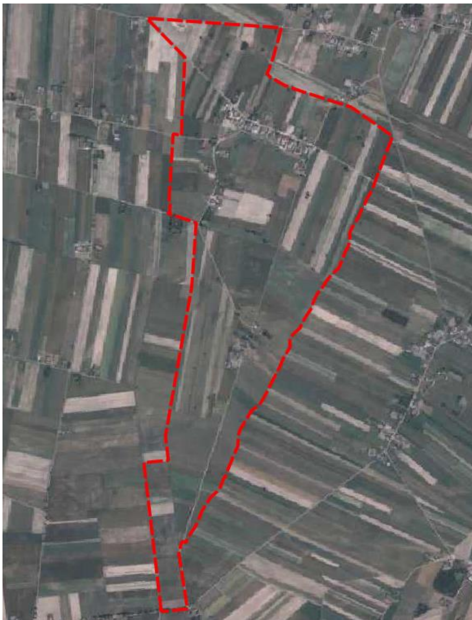
Rysunek 2 Obszar objęty ustaleniami planu miejscowego na tle ortofotomapy.

Krajobraz obszaru opracowania charakteryzuje się dużym udziałem terenów rolnych. Występuje tu również zabudowa mieszkaniowa skoncentrowana wzdłuż drogi lokalnej w północnej części obszaru.