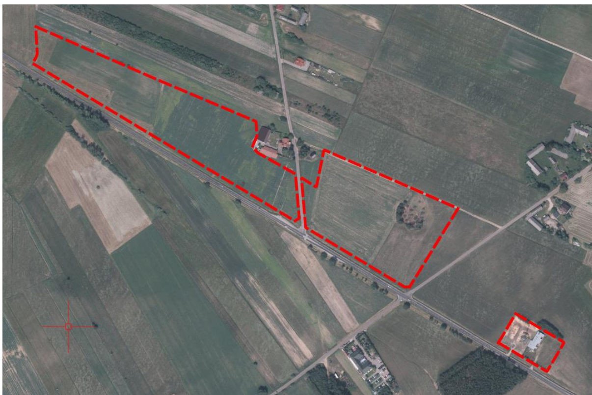
Rysunek 2 Obszar objęty ustaleniami planu miejscowego na tle ortofotomapy.

Krajobraz obszaru opracowania charakteryzuje się dużym udziałem terenów rolnych. Występuje tu również jeden budynek gospodarczy. Wzdłuż południowej granicy obszaru przebiega droga wojewódzka nr 618 klasy głównej.