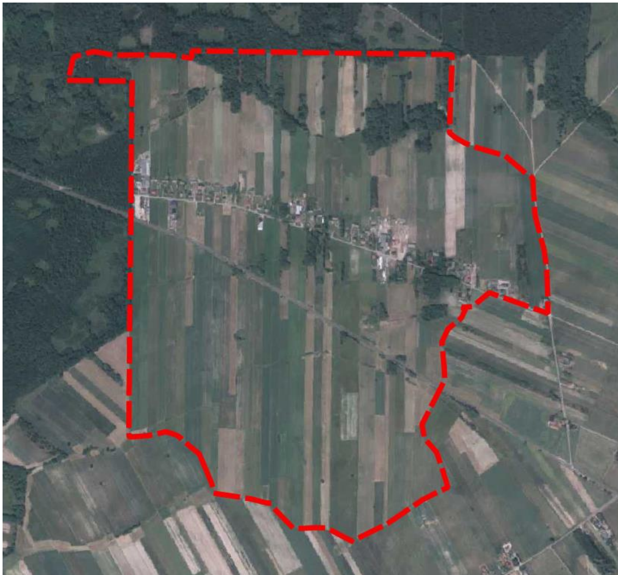
Rysunek 2 Obszar objęty ustaleniami planu miejscowego na tle ortofotomapy.

Krajobraz obszaru opracowania charakteryzuje się dużym udziałem terenów rolnych i leśnych. Występuje tu również zabudowa mieszkaniowa i usługowa skoncentrowana wzdłuż drogi gminnej lokalnej w centralnej części obszaru. Przez centralną część obszaru, na południe od drogi lokalnej przebiega droga wojewódzka nr 618 klasy głównej.